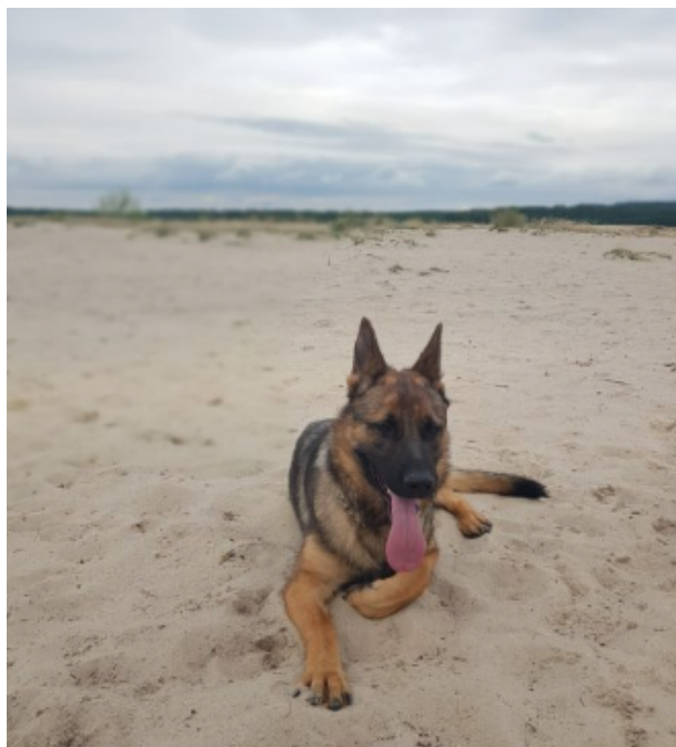
fot. Volta na pustyni błędowskiej