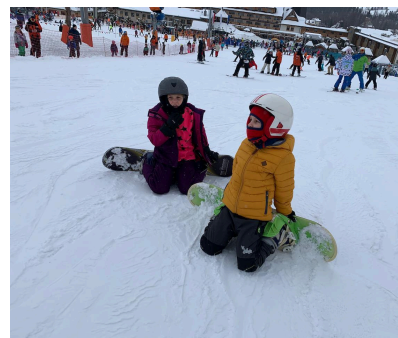
fot. uczestnicy podczas wydarzeń Outdoor Hub