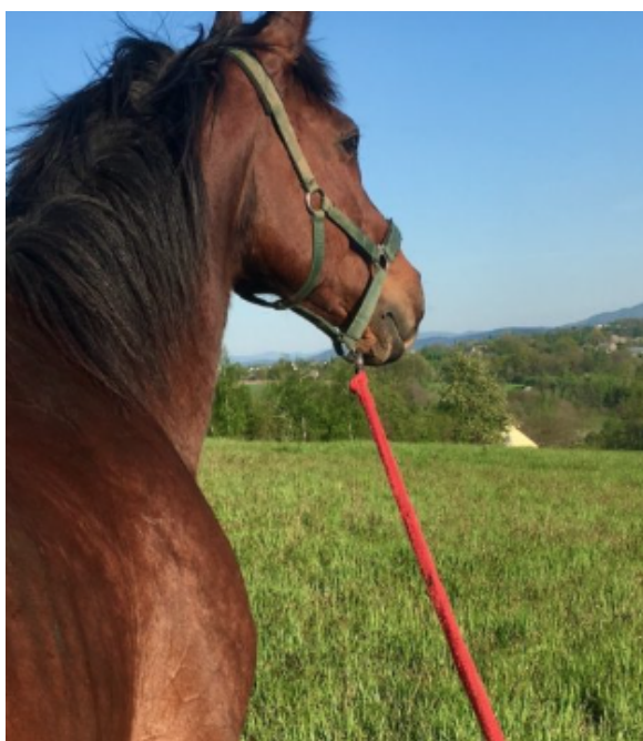
fot. Tower na pastwisku

Na realizację programu Fundacja uzyskała środki w formie darowizn od osób fizycznych i podmiotów gospodarczych w łącznej kwocie 8.500 zł.