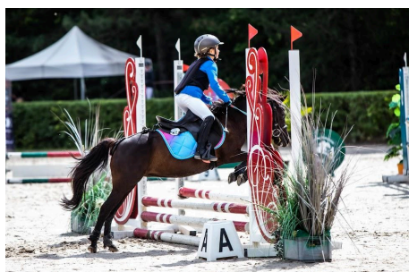
fot. Zawodniczki KS Equihub podczas zawodów w WLKS KRAKUS w Krakowie Swoszowicach