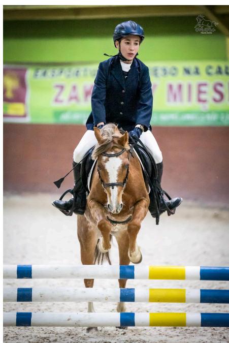
fot. Zawodniczki KS Equihub podczas zawodów halowych w Centrum Hipiki Antoniego Chłapowskiego w Jaszowie k. Poznania