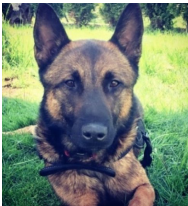
fot. Dante na łące