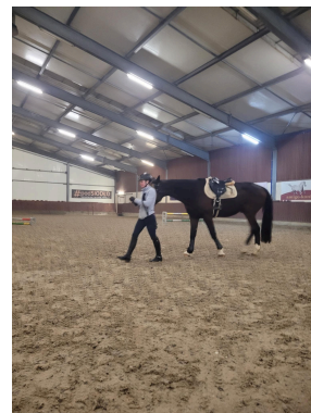
fot. uczestnicy programu podczas treningów indywidualnych i grupowych