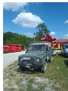
fot. uczestnicy podczas wydarzeń Outdoor Hub

Na realizację programu Fundacja uzyskała środki w formie darowizn od osób fizycznych i podmiotów gospodarczych w łącznej kwocie 11.200 zł.